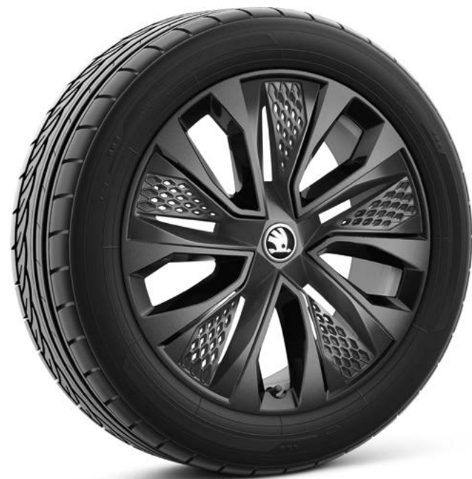
18" Procyon Aero zwart