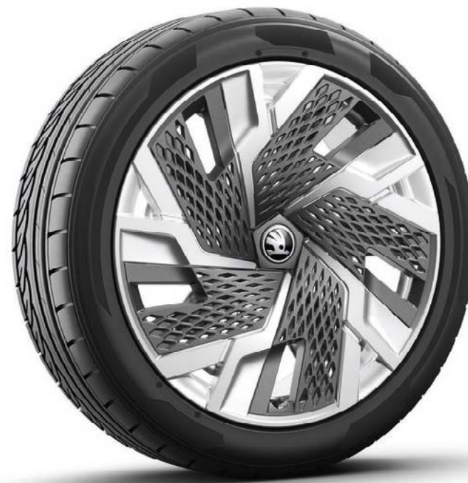
19" Sagitarius Aero antraciet gepolijst