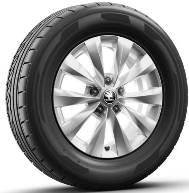
16" Castor zilver