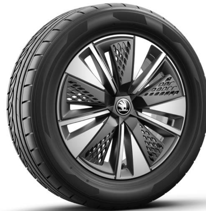
17" Scutus Aero antraciet gepolijst