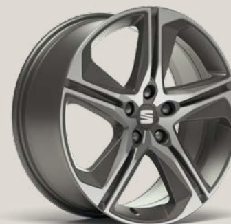
Performance 2 FBI FPH PUN