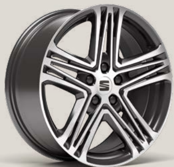
Performance FBI FPH PUM