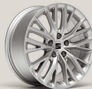
Performance St PUB