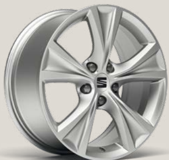
Dynamic FBI FPH