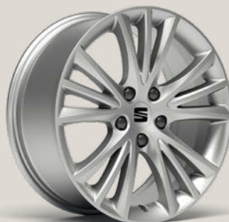
Dynamic St PUA